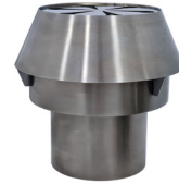
Chimenea / Chimney Ref. 759.013

* Este horno tiene la posibilidad de ser utilizado con múltiples tipos de parrillas (varilla, acanalada, pinchos, planchas, etc.) y medias parrillas. El límite lo pone la habilidad e imaginación del chef.