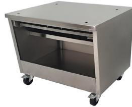
Mesa / Table Ref. 770.350