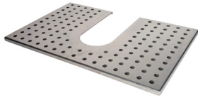
Atemperador / Warming Tray Ref. 920.050