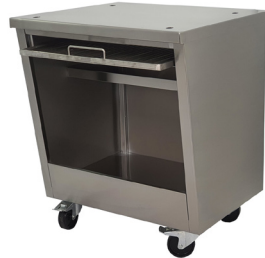
Mesa / Table Ref. 770.348