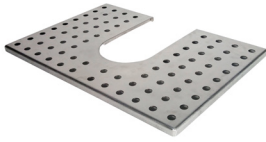
Atemperador / Warming Tray Ref. 920.048