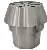
Chimenea / Chimney Ref. 759.012

* Este horno tiene la posibilidad de ser utilizado con múltiples tipos de parrillas (varilla, acanalada, pinchos, planchas, etc.) y medias parrillas. El límite lo pone la habilidad e imaginación del chef.