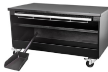
Mesa / Table Ref. 770.220 (Lux) Ref. 770.320 (Silver)