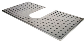
Atemperador / Warming Tray Ref. 920.120