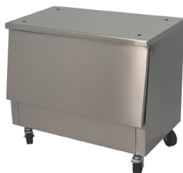
Mesa / Table Ref. 773.500 (Lux) Ref. 773.501 (Silver)