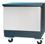
Mesa / Table Ref. 773.500 (Lux) Ref. 773.501 (Silver)