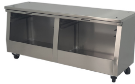
Mesa / Table Ref. 773.535 (Lux) Ref. 773.536 (Silver)