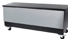
Mesa / Table Ref. 773.535 (Lux) Ref. 773.536 (Silver)